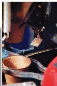
Dépilage automatique du FERTILPOT

2 – Lorsque le végétal en FERTILPOT est planté ou repoté sans enlever le pot, les bourgeons racinaires dormants mis en place lors du cernage aérien se réveillent immédiatement. Il n'y a pas de choc de transplantation. Cette différence est particulièrement sensible lorsque les conditions sont difficiles (froid, sécheresse, saison défavorable...). Enfin, la non-déformation du système racinaire assure un bon ancrage de la plante et une meilleure prospection du sol.